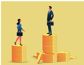
TABLE RONDE N°3 / 14H30