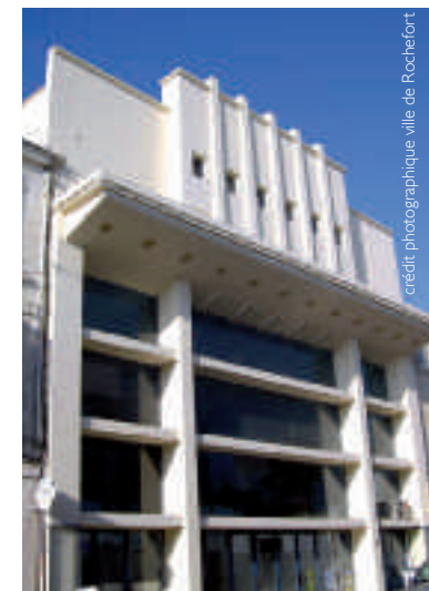
Aujourd'hui, le cinéma L'Alhambra-Colbert a laissé la place à un studio d'enregistrement.

Chaque soir, l'équipe du film se retrouve autour de Jacques Demy dans ce cinéma pour visionner les rushes et imaginer le montage définitif du film. Ensuite les vedettes sont souvent conviées à des soirées organisées en leur honneur par le Ciné-club, l'Office du tourisme, la Base aérienne... Puis chacun rentre chez soi, à l'hôtel Le Continental, au Paris ou au Grand Bacha à Rochefort. Danielle Darrieux, Catherine Deneuve et Françoise Dorléac séjournent à Fouras.