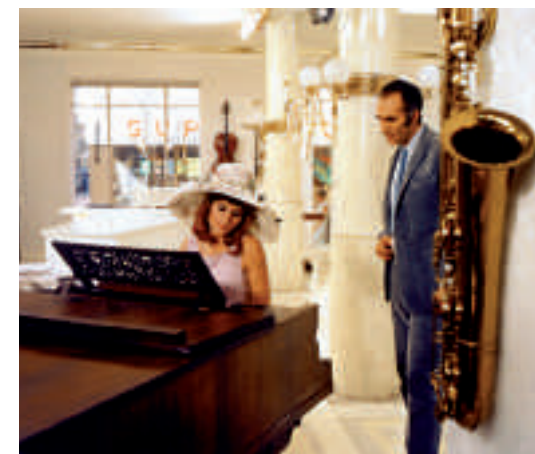
Solange, (Françoise Dorléac) et monsieur Dame (Michel Piccoli).

Piccoli, aménagé dans un coin de la Bourse du commerce. Le bâtiment incendié en 1970 est reconstruit et désormais ce sont les poissonniers qui chantent pour attirer la clientèle les jours de marché.