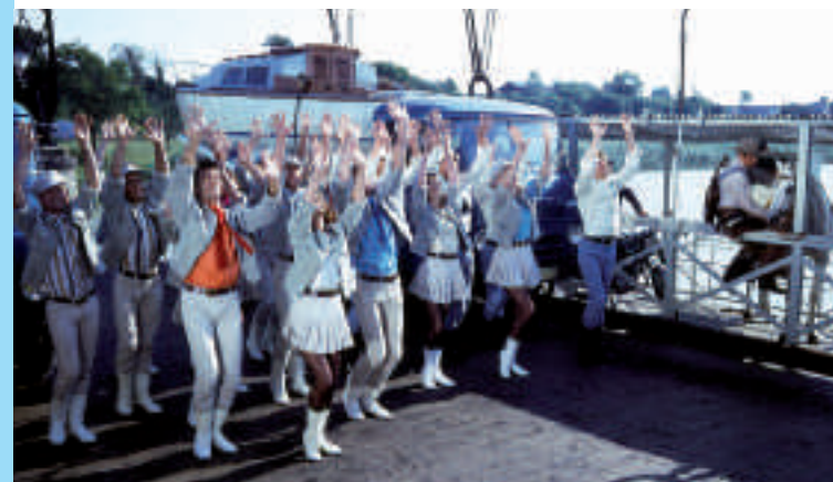
L'arrivée des forains par la nacelle du pont transbordeur.