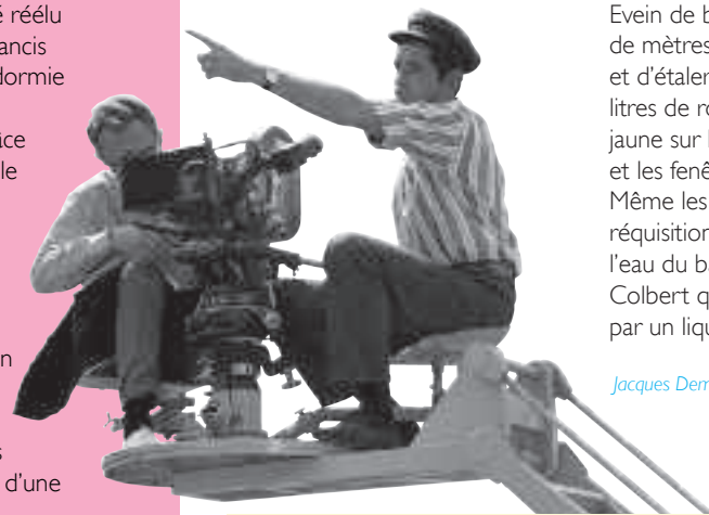
Jacques Demy sur le tournage.

1966 est une année magique pour la ville fondée exactement trois cents ans plus tôt par Colbert, Jacques Demy pensait tourner « Les Demoiselles d'Avignon » ou « Les Demoiselles d'Hyères », mais l'architecture de Rochefort