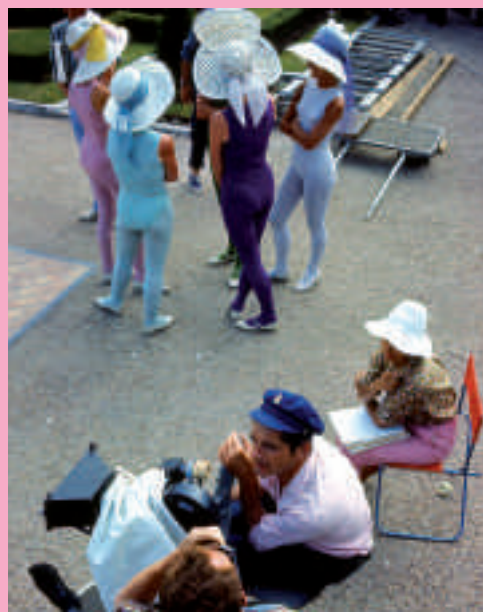
Jacques Demy et les danseuses du ballet anglais.

Pour un Rochefortais, le tournage d'une superproduction en Cinémascope et couleur est l'occasion ou jamais de faire du cinéma de figuration. Alors on flâne du côté des répétitions et des derniers préparatifs, les sens toujours en éveil pour être sûr de ne pas passer à côté d'une vedette du film sans la voir. On profite de ce spectacle si joyeux en faisant semblant d'oublier que toute cette agitation aura forcément une fin.