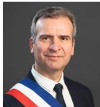
Hervé BLANCHÉ Maire de Rochefort