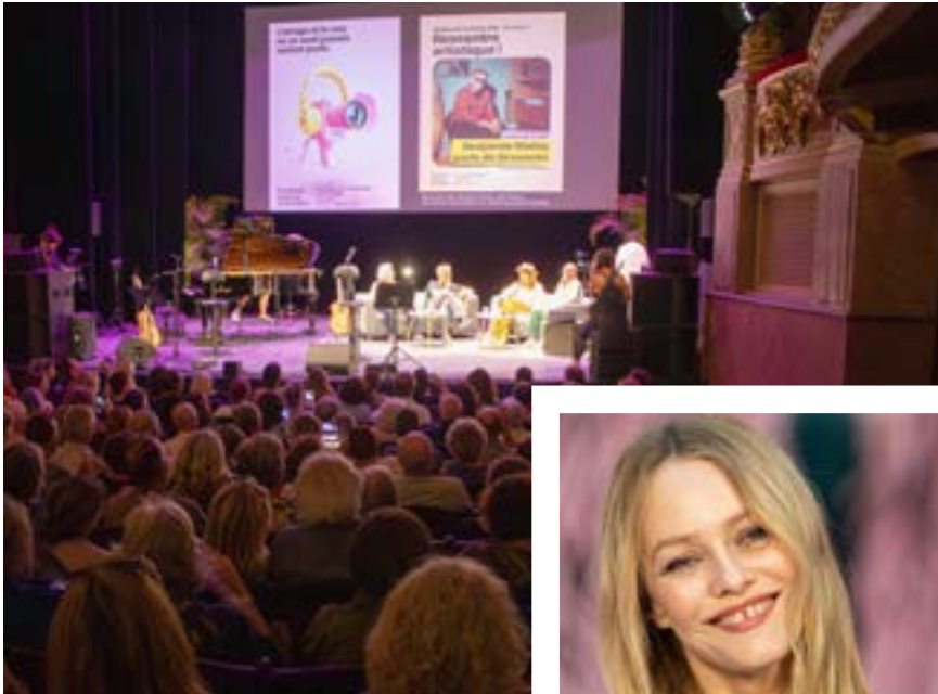
Les rencontres artistiques : une marque de fabrique des Sœurs Jumelles / Vanessa Paradis