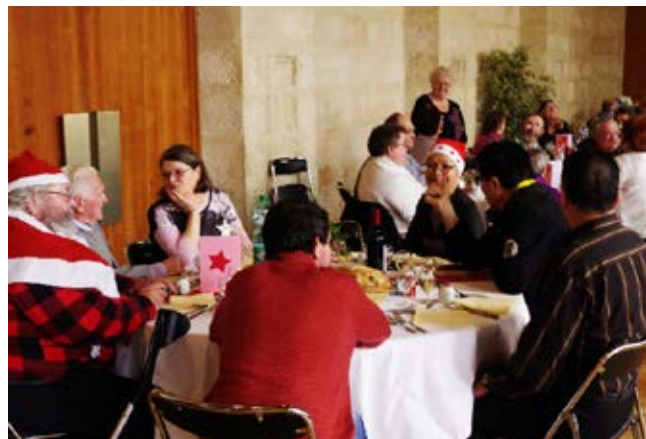
Noël solidaire : un déjeuner convivial et en chansons

Inscriptions au CCAS jusqu'au 7 décembre dernier délai, du lundi au vendredi matin (9 heures – 12 h 30 / 13 h 30 – 16 h 30).