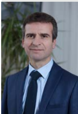
par Hervé BLANCHÉ

Maire de Rochefort Président de la Communauté d'agglomération Rochefort Océan