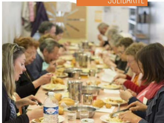
Des déjeuners qui sont aussi d'agréables moments d'échange

Si vous avez plus de 80 ans, vous pouvez bénéficier du dispositif « SortirPlus » financé par les caisses de retraite : contre la somme de 15 € votre caisse vous remettra des « chèques transport accompagné » d'une valeur de 150 € (20 € pour le deuxième chèque, 30 € pour le troisième).