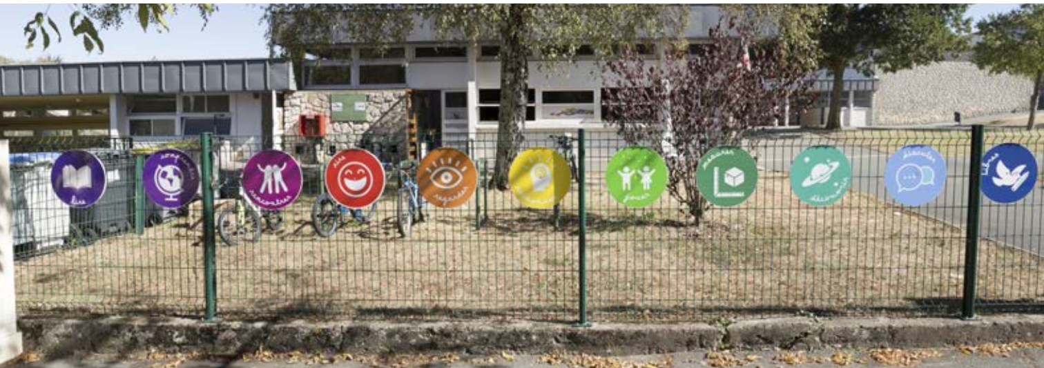
Les élèves veillent eux-mêmes au respect du code couleur qu'ils ont créé

Voilà plus de 50 ans que l'école Saint-Exupéry trône au beau milieu du quartier de la Gélinerie. Six salles de classe agréables, certes, mais l'école est composée de deux bâtiments desservis par trois entrées. De quoi perdre certains parents sans parler des intervenants extérieurs ne sachant plus à quel portail se vouer. D'où l'idée de doter l'établissement d'une signalétique efficace. Et quel meilleur concepteur que le principal utilisateur des locaux pour savoir diriger dans ses couloirs et escaliers ceux qui sont amenés à s'y aventurer ? Le Conseil d'école a donc fait le choix de confier cette mission aux élèves eux-mêmes sous la houlette de leurs enseignants (es) respectifs (ves). Et pas seulement puisqu'ils ont aussi bénéficié des conseils avisés d'une architecte. Car on ne touche pas aux bâtiments sans être familiarisé à un minimum de règles : ce fut la tâche de Véronique Parent.