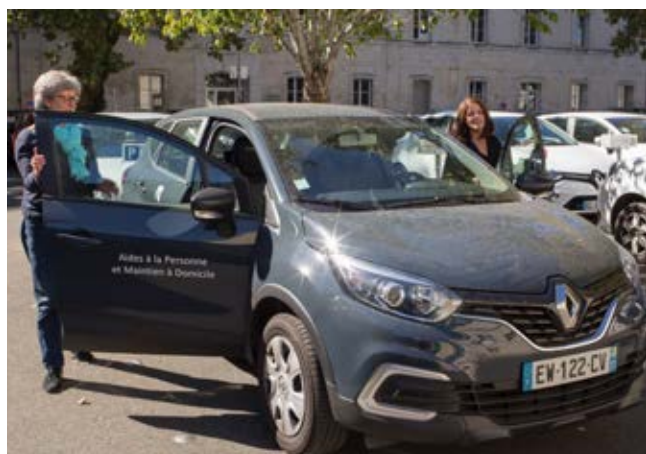
Vous êtes accompagné(e) en voiture vers l'endroit de votre choix