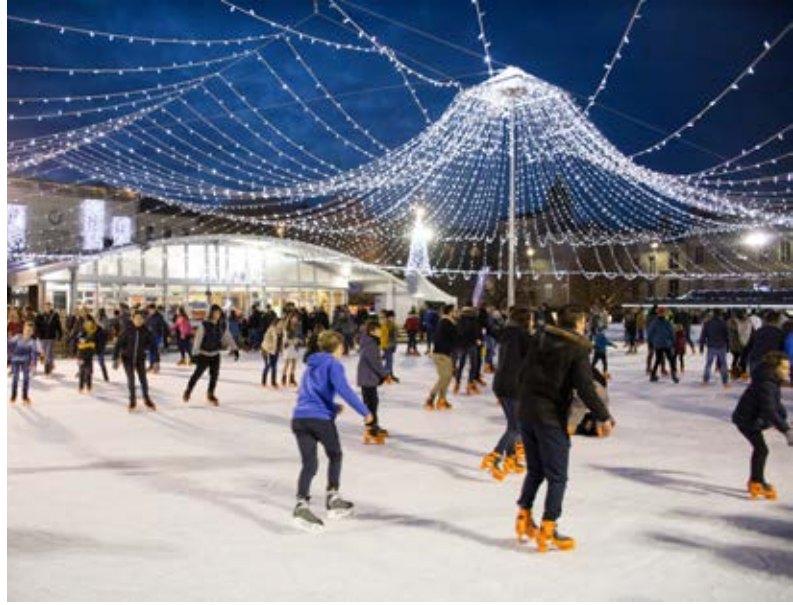
La patinoire de Rochefort attire environ 25 000 visiteurs